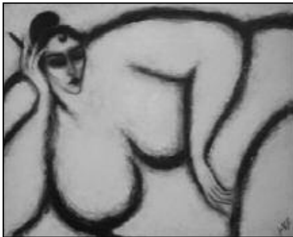
Hélène Berton - Femeia cu țigară 2